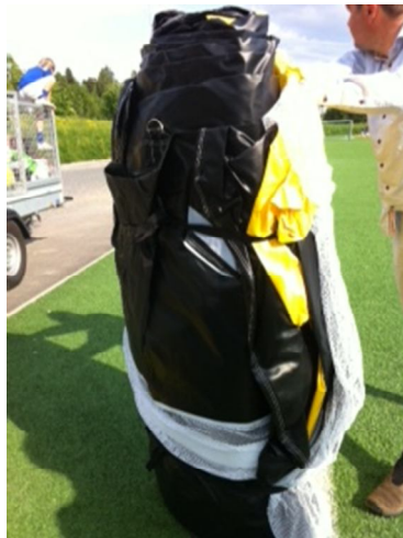
På høykant etter at sekk er trukket av første gang