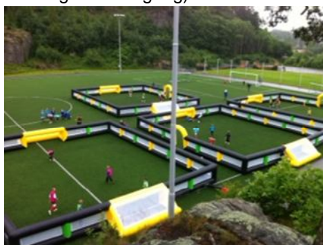
4 baner i Kristiansand utendørs

Fest på pumpe og fyll inn litt luft for å se om det blir korrekt (lett at det er opp/ned, vridninger første gang)