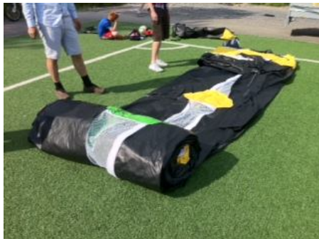
Rull ut på bane